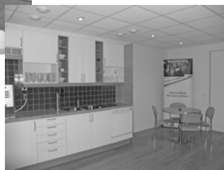
Våra kurslokaler på Vendevägen 85 B, Danderyd